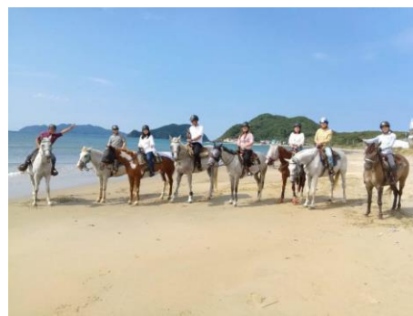
福岡県福津市：福津海岸