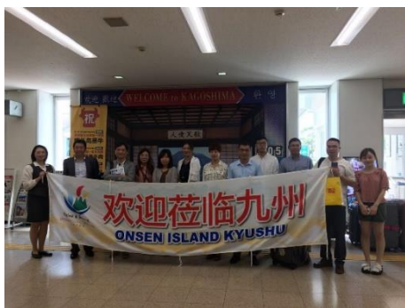
空港での歓迎の様子

MOU 締結中国旅行社のうち 10 社・10 名を招請し、温泉、生活文化体験、日本特有の食文化、二次交通など、FIT 旅行者向けの観光素材を中心に視察しました。砂蒸し風呂や着付け体験、福津海岸でビーチ乗馬体験など大変好評でした。今後、この 10 社が九州旅行商品を造成し、OTA サイト及び自社 HP や SNS に掲載し情報発信することとしており、九州の知名度の向上と送客数増加につながるものと期待されます。