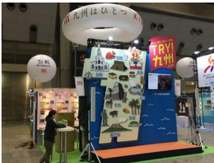
九州エリアで統一した装飾 (バルーン)

○ 「ツーリズム EXPO ジャパン 2018」の来場者数(速報値): 207,000 人(前年比 108%)