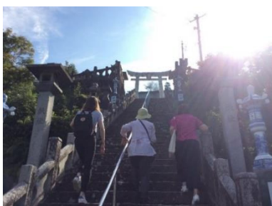
長崎県五島市：明星院

今年度 VJ 事業として、先月のフィンランド航空機内誌 Blue Wings フォトライター招請に引き続き、訪日インバウンドメディア Voyapon のフォトライター 1 名を招請しました。同事業の中でも、今回の招請は、フィンランド航空が就航しない冬季期間の誘客対策として、日本をすでに訪問中の欧州外国人観光客をターゲットに情報発信を行うことを目的としています。Web メディアという特性を鑑みて、焼き物の歴史が残る有田町や、今年世界遺産に登録された長崎の禁教の歴史といったストーリー性の高いスポットかつ通年を通して見学可能なスポットを訪問地として選定しています。ライターからは、ゴールデンルート上の都市より混雑していないというのは逆に九州の強みであり、特におもてなし精神、歴史、自然、食事等、九州の観光地としての魅力は大きいとの感想をいただきました。引き続き、九州観光情報及び九州へのアクセスについて情報発信に努めていきます。