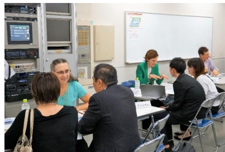
海外ライターとの商談