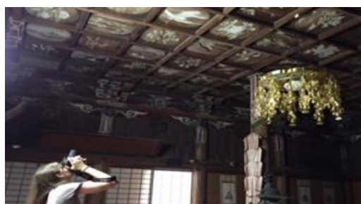
佐賀県有田町：陶山神社