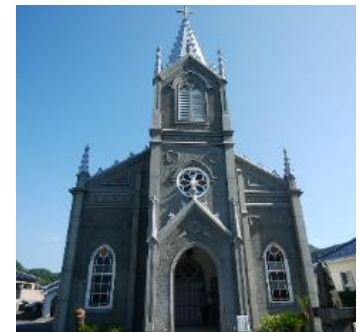
天草 カトリック埼津協会

「九州の世界遺産」をテーマとして首都圏でのプロモーションを実施するため、インフルエンサーを招へいする現地取材を実施しました。長崎と熊本両県を周遊するダイナミックな旅を、若い女性の視点で取材し、様々な SNS 媒体で発信して頂きました。「長崎と天草地方の潜伏キリシタン関連遺産」は 6～7 月に開催される世界遺産委員会で世界遺産リストへの登録を予定しています。今後、首都圏で開催する BtoC セミナーで九州の世界遺産を広く PR していく準備を進めてまいります。