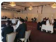
昨年の商談会の様子