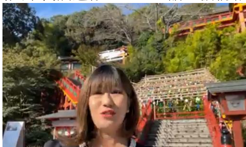
祐徳稲荷神社の素晴らしい景観を 説明する佐賀県観光連盟職員