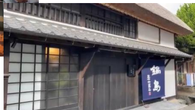
旧商家を酒蔵オーベルジュに再生させた 富久千代酒造様の思いを語る機構職員