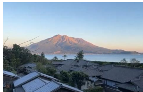
仙巖園から望む夕方に染まった桜島