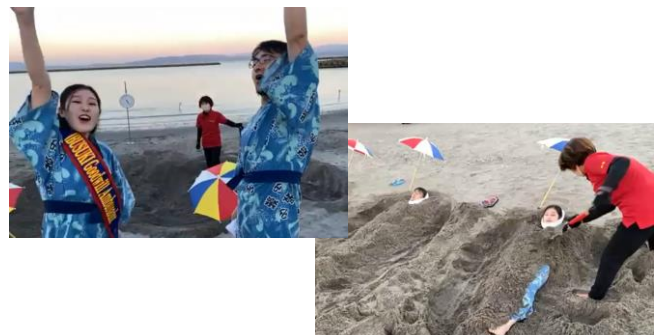
海岸で天然砂蒸し風呂を体験する いぶすき菜の花大使と機構職員